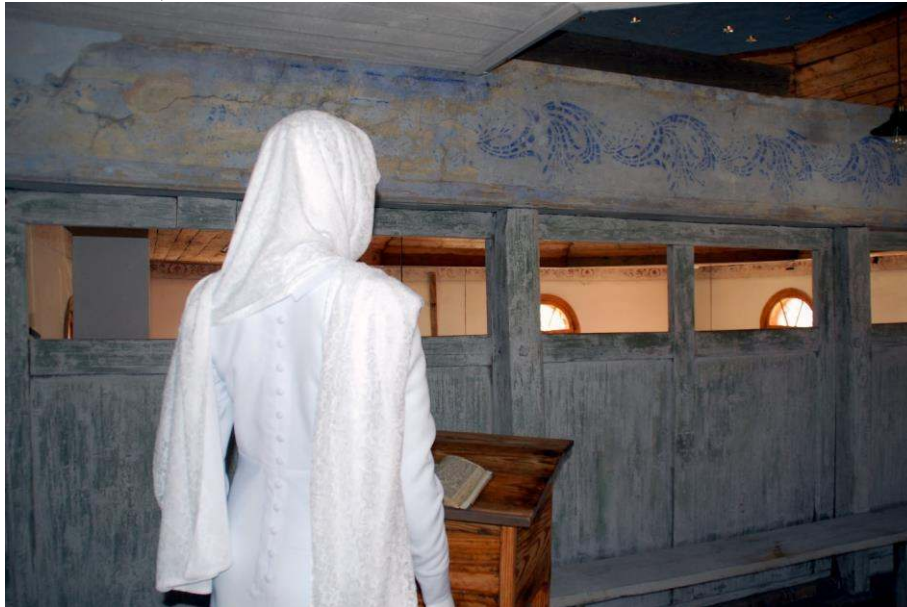
Foto: Ekspozīcijas daļa 2. stāvā