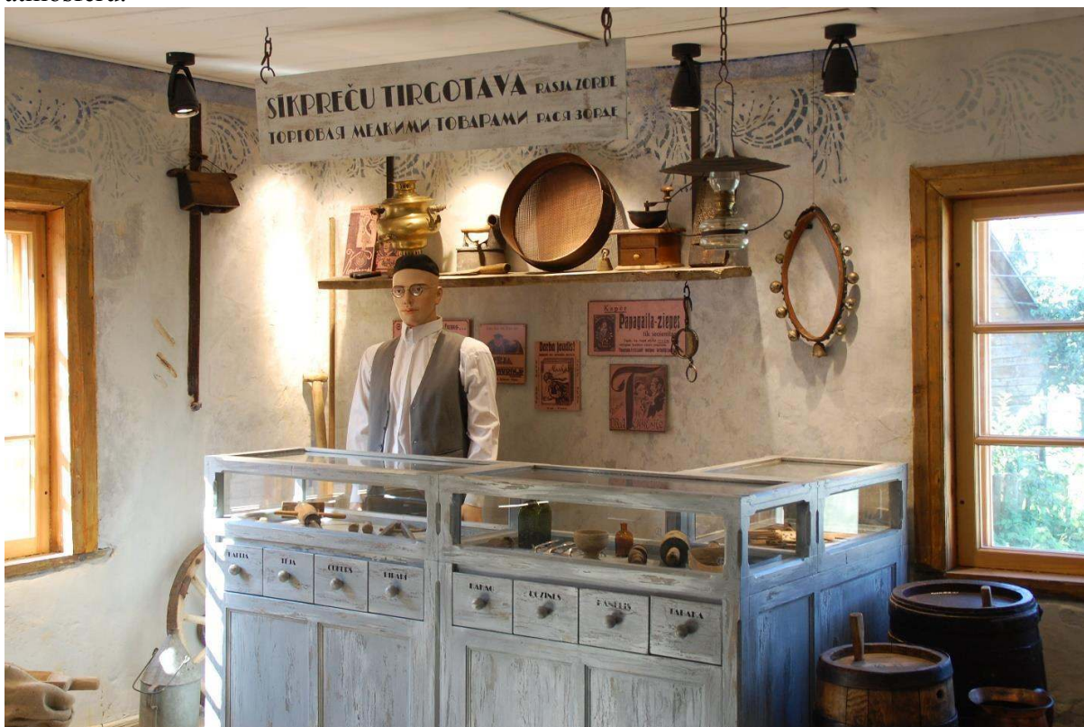
Foto: Ekspozīcijas daļa “Hasjas Zorde sīkpreču tirgotava” 2. stāvā

Otrajā stāvā apmeklētājus gaida pārsteigums – ebreju bodīte ar nosaukumu “Hasjas Zorde sīkpreču tirgotava”. Ekspozīciju veidoja mākslinieki Gunita un Andris Misāni. Darba gaitā mākslinieki maksimāli centušies pieturēties sinagogas stilam, radot pēc iespējas autentiskāku atmosfēru.