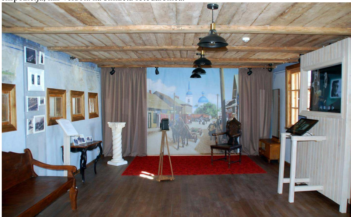
Foto: Ekspozīcija 1. stāvā