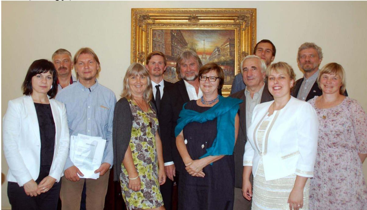
Foto: Projekta dalībnieki un partneri no Hordalandas Muzeju centra

amatnieku apmācības un pieredzes apmaiņa ar projekta partneriem – Hordalandas Muzeju centru (Norvēģija).