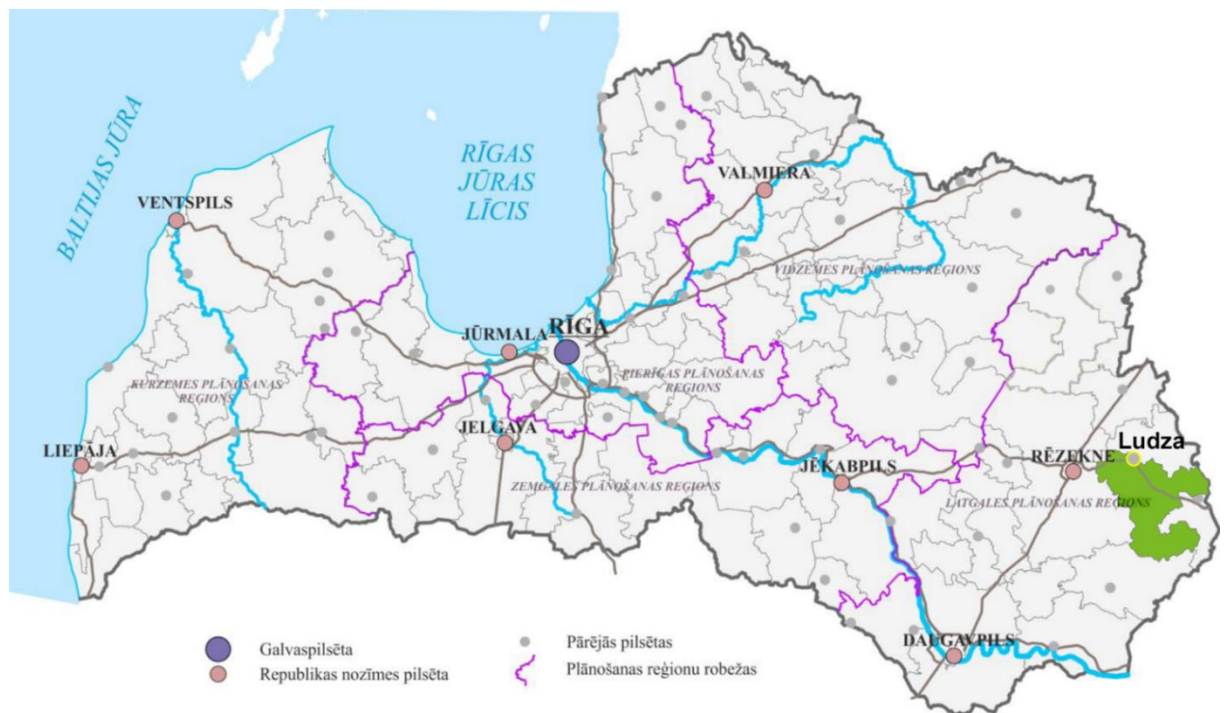
1.1.att. Ludzas novada ģeogrāfiskais novietojums

Novada administratīvais centrs ir Ludzas pilsēta. Tā atrodas 267 km attālumā no valsts galvaspilsētas Rīgas, 122 km attālumā no Daugavpils un 30 km attālumā no Rēzeknes (skat.1.1.att.). Ludzas novads robežojas ar Ciblas novadu, Zilupes novadu, Rēzeknes novadu un Dagdas novadu. Robeža ar Krievijas federāciju (14,7 km gara robeža) ir arī valsts robeža. Ludzas novada administratīvajā teritorijā ietilpst Ludzas pilsēta un 9 pagasti – Briģu, Cirmas, Isnaudas, Istras, Nirzas, Ņukšu, Pildas, Pureņu un Rundēnu.