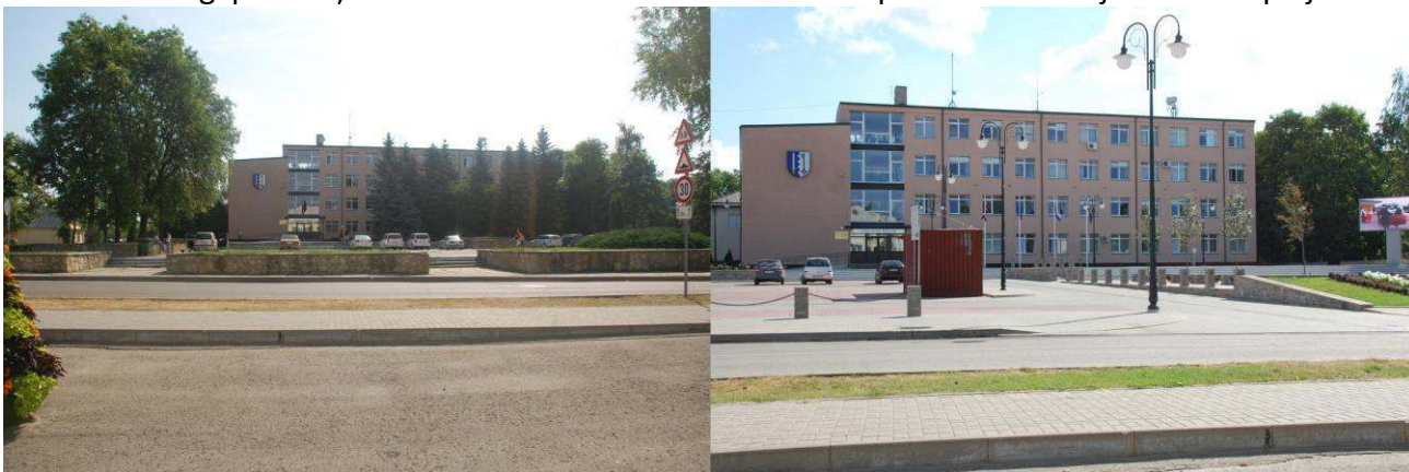
Laukums pie pašvaldības pirms un pēc rekonstrukcijas

Savas pilsētas pozitīvas pārvērtības bieži vien mēs varam pamanīt tikai tad, kad pie mums atbrauc viesi un izstāsta par saviem iespaidiem. Bet ikdienā retais aizdomājas, cik spēka, enerģijas, laika un veselības ir ieguldījuši cilvēki, kas rīkoja pasākumu Jūs priekam, organizēja Jūsu mājas siltināšanu, izremontēja ielu, kur Jūs dzīvojat. Bet runa nav par to. Visiem galvenais ir rezultāts. Un var pateikt, ka Ludzā labi rezultāti ir sasniegti diezgan īsā laikā: pēdējo trīs gadu laikā tika izremontēti vairāk nekā 10 pilsētas ielu posmi un divi laukumi vēsturiskajā pilsētas daļā un centrā. Tagad jau kāja nevar aizķerties aiz kādu vecu dzelzi, kas bija izlīdusi no betona plātnēm laukumā pie pašvaldības. Vecā, padomju laikā būvētā laukuma vietā ir izveidots gan autotransporta stāvlaukums, gan atpūtas zona ar soliņiem, jauniem kokiem un puķu dobēm. Šis objekts, iespējams, bija viens no sarežģītākajiem, jo mazā teritorijā būvniekiem bija jāpaveic diezgan daudz dažādu darbu. Ludzas pilsētas iedzīvotāji varēja redzēt, cik rūpīgi mūrnieki lika akmens sienas, atsevišķi veidojot katra akmens formu. Naktī laukumu apgaismo ne tikai laternas, bet arī lampiņas, kas ir iebūvētas bruģī pie soliņiem. Šis laukums izskatās modernāks pateicoties lielajam LED displejam.