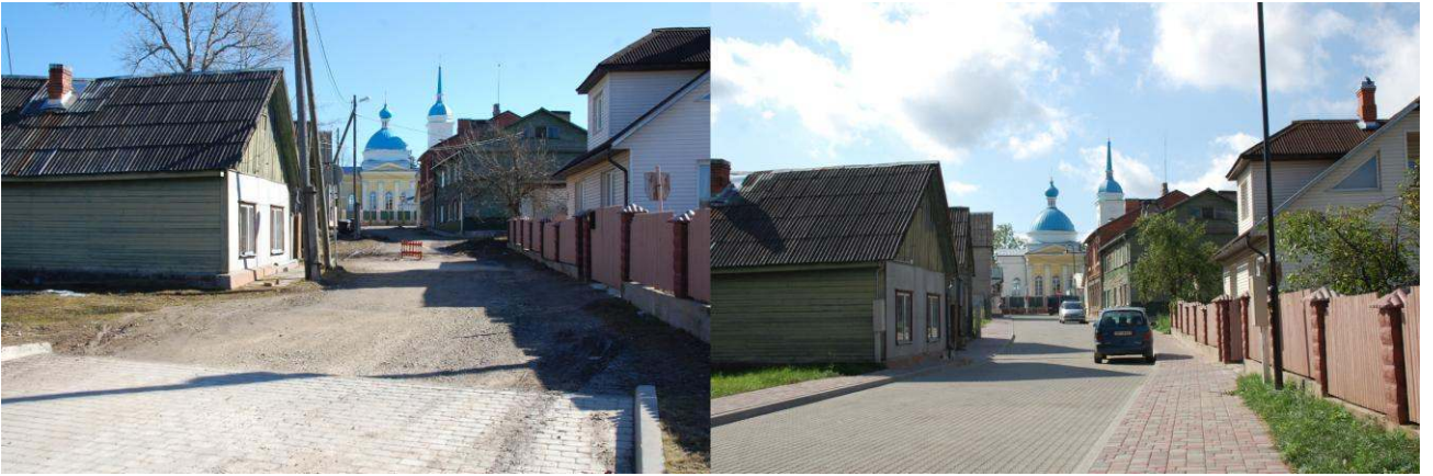
Ezera šķērsiela pirms un pēc rekonstrukcijas

Rekonstruēto ielu iedzīvotāji zina, ka darbi nav gājuši gludi un bez problēmām. Bet visu var atrisināt, pateicoties veiksmīgai sadarbībai ar iedzīvotājiem, būvniekiem un projektētājiem.