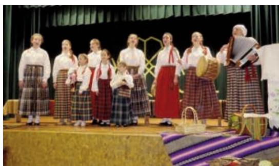
Foto: Kad cilvēks dzied no sirds, viņu apņēm likums, možums, labs prāts, mīlestības un gaišuma sajūta. Dziesma dziedina.

Ņukšu Tautas nama bērnu folkloras kopa „Rīkšoveņa” 26. novembrī svinēja savas darbības 5 gadu jubileju. Kolektīvs dibināts 2011. gada 20. novembrī. Visus šos pastāvēšanas gadus kopas dalībnieces ir priecējušas sava pagasta ļaudis, gan arī iesaistījušās bērnu un jauniešu festivāla „Pulkā eimu, pulkā teku” ietvaros un ir pabijušas Gaigalavā, Jēkabpilī, Viesītē, Dricānos, Rogovkā, Ludzā, Rīgā un Saldū.