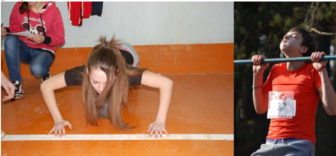
Ludzas jaunieši startē sacensībās Braslavā, Baltkrievijā

Ziemā projektam „Veselīga dzīvesveida veicināšana Latvijas un Baltkrievijas pierobežas reģionos”/ „Move for Life” (LLB-2-255) ir sācies jauns etaps. Ja vasarā un rudenī tika veikti parka apgaismojuma rekonstrukcijas darbi, tika iegādāts slēpošanas inventārs, tad ziemā jau norisinājās pavisam citi pasākumi – tās bija sporta sacensības jauniešiem un ģimenēm. Ziemā pievīla projekta partneru cerības, var teikt, ka sniegu mēs gandrīz neredzējām, līdz ar to arī nevarējām pielietot iegādāto inventāru un organizēt slēpošanas sacensības – to vietā partneri rīkoja to, ko ļāva laika apstākļi.