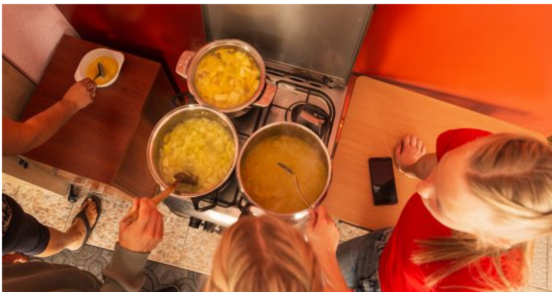
“Latvales virtuves noslēpumu meklējumos”