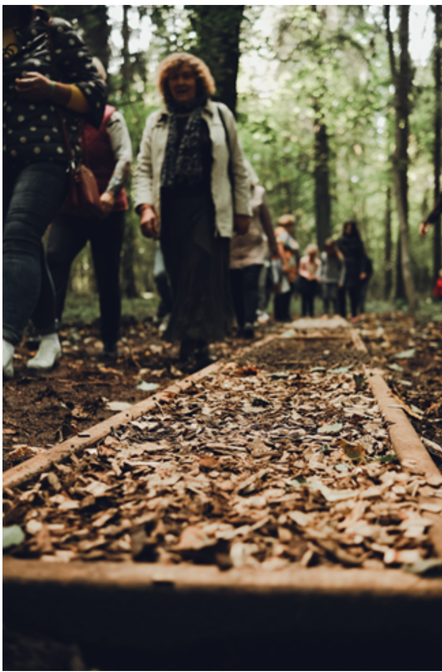
Divvietīgas koka šūpoles