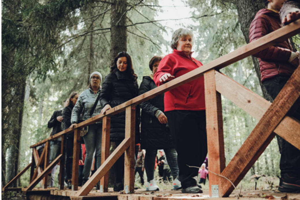
380 m gara un 2,5 m plata gājēju taka.

Pa Zīdūņa parka teritoriju ir izvietotas mazās arhitektūras formas un labiekārtojuma elementi: