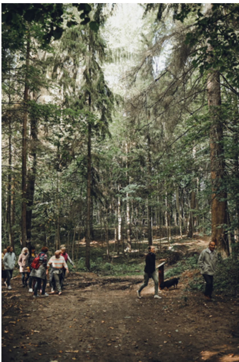
Projekta ietvaros ir izveidota 1 km 306,9 m gara un 4,5 m plata trase.