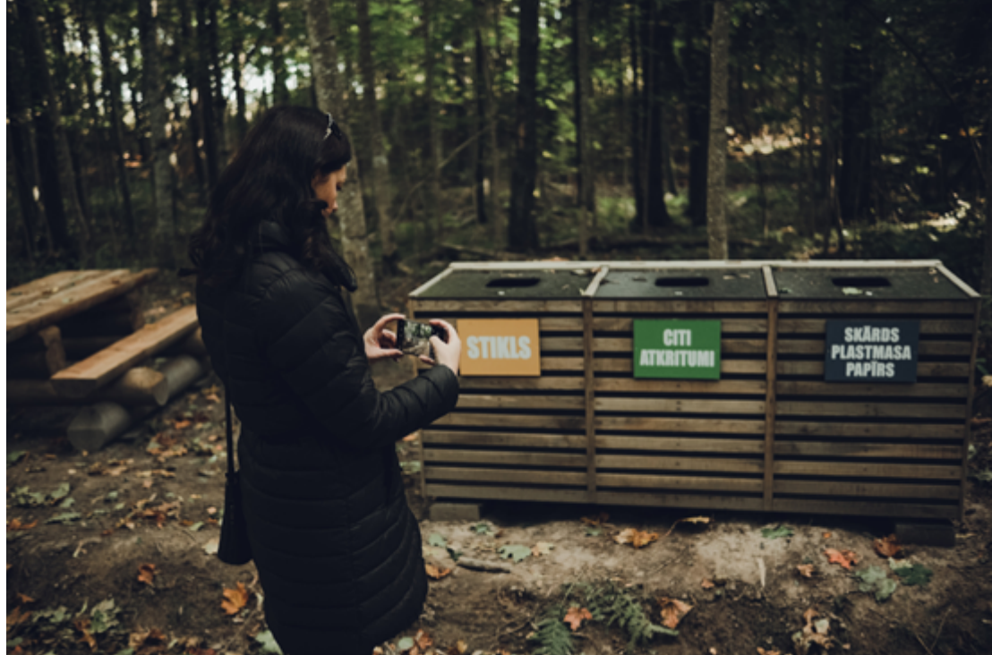
4 Guļbaļķu galdi ar diviem soliem, 4 atkritumu urnas ( 3 nodalījumi ar uzrakstiem- atkritumu šķirošanai).