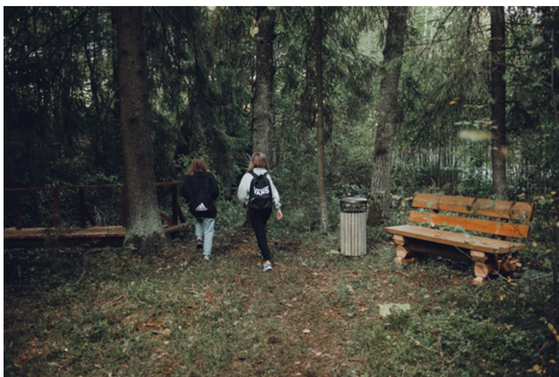
4 parastās atkritumu urnas, 8 koka soli ar atzveltni.