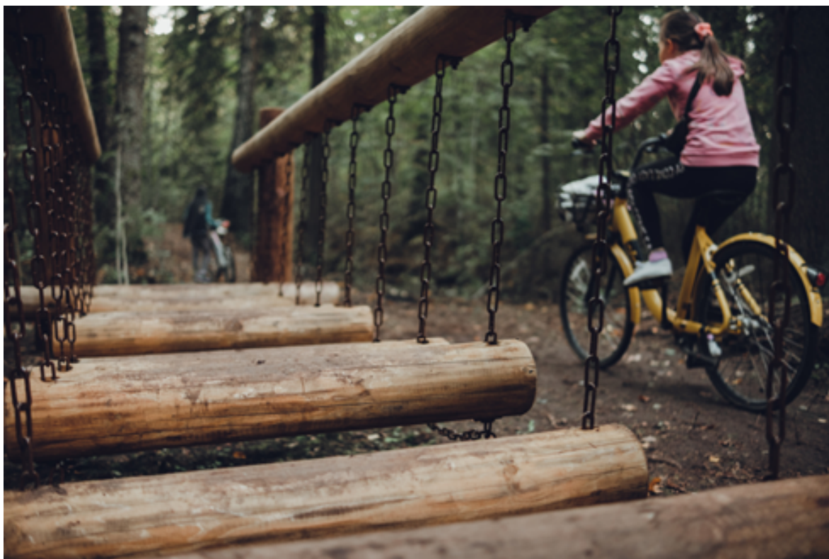
Līdzsvaru tilts, ugunsкура vieta.

IK "Lapsiņas K" šā gada 2. novembrī piegādāja iztrūkstošo aprīkojumu – divas divvietīgās un trīs trīsvietīgās teltis kokos. Līdz ar to projekta realizācija ir noslēgusies.