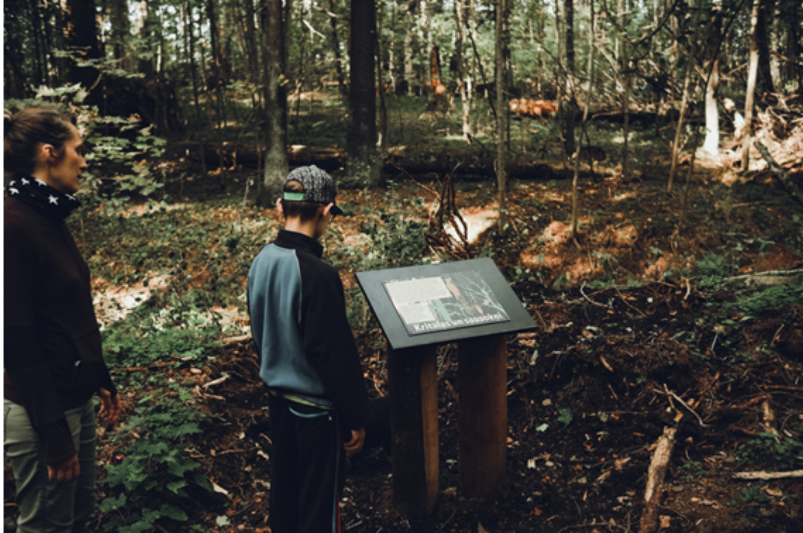
10 katedras veida informācijas stendi.