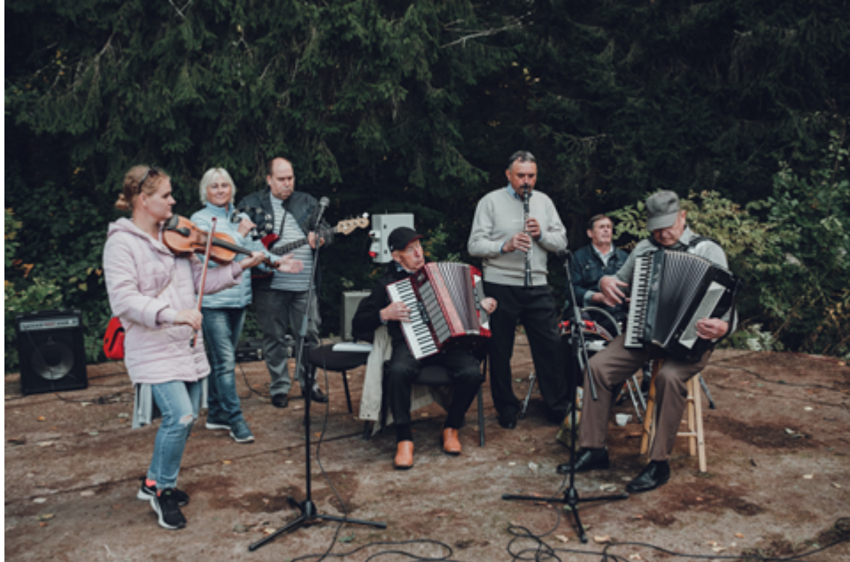
Kapella "Malnavas muzikanti"