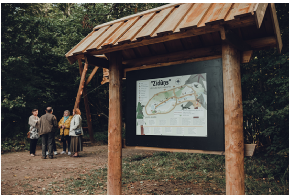
Informācijas stends ar jumtiņu.

Pa Zīdūņa parka teritoriju ir izvietotas mazās arhitektūras formas un labiekārtojuma elementi: